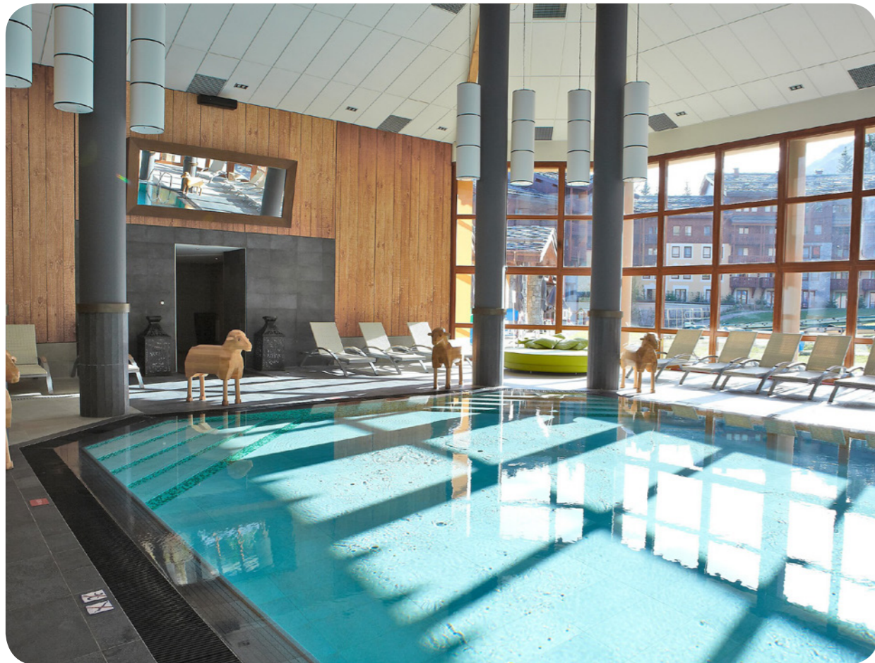
Pool (120 m 2 ) und Kinderbecken (15 m 2 ). Tiefe (min./max.) 0.8M / 1.4M Beheizt