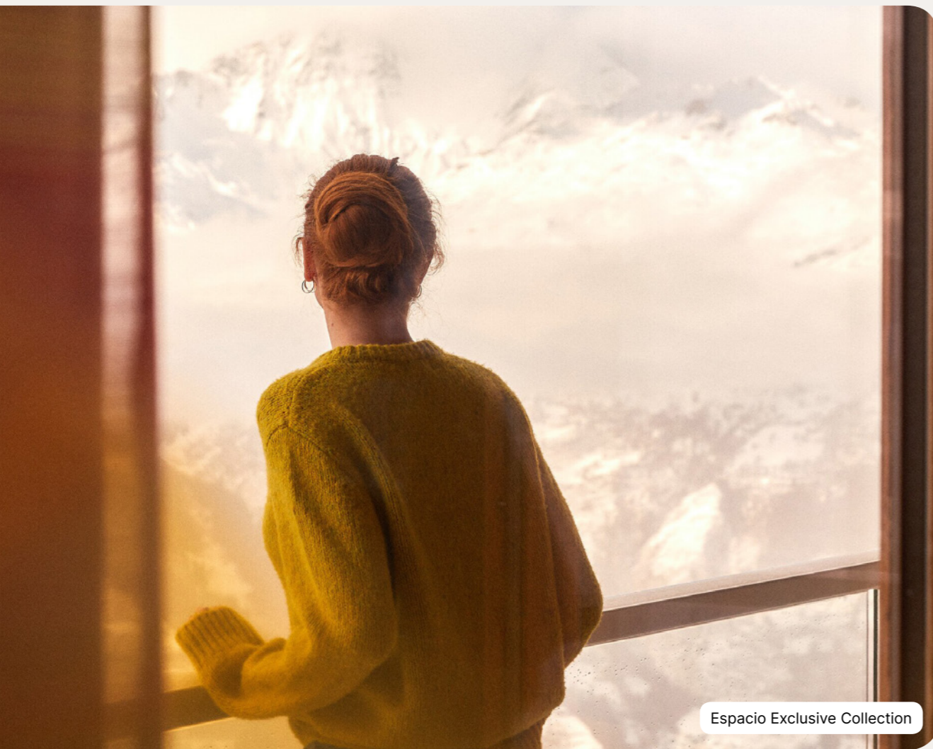
Espacio Exclusive Collection