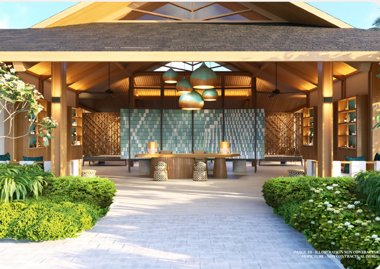
IMAGE 3D - ILLUSTRATION NON CONTRACTUELLE 3D PICTURE - NON CONTRACTUAL IMAGE

Vos sens s'éveillent doucement aux parfums de nos huiles et crèmes de qualité, sélectionnées pour vous.