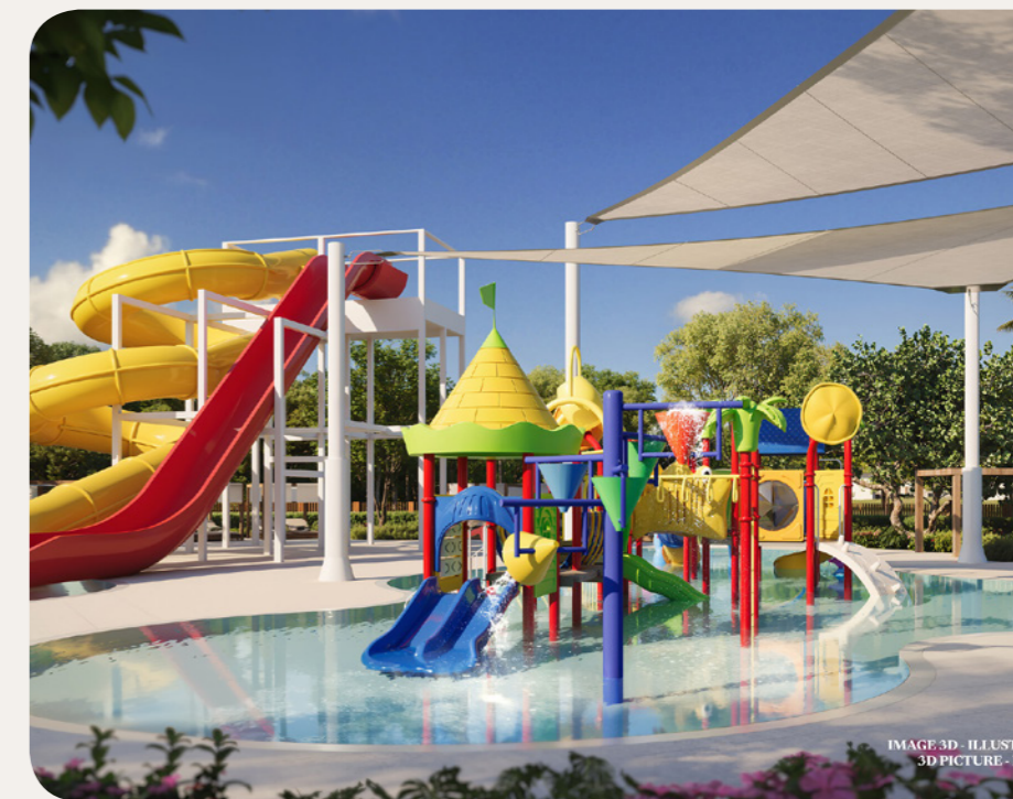
IMAGE 3D - ILLUSTRATION 3D PICTURE

Plongez dans un univers ludique avec des toboggans palpitants et des bassins peu profonds. Une façon idéale de se rafraîchir tout en partageant des moments privilégiés en famille.