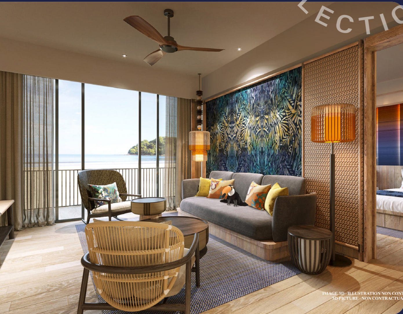
IMAGE 3D - ILLUSTRATION NON CONTRACTUELLE 3D PICTURE - NON CONTRACTUAL