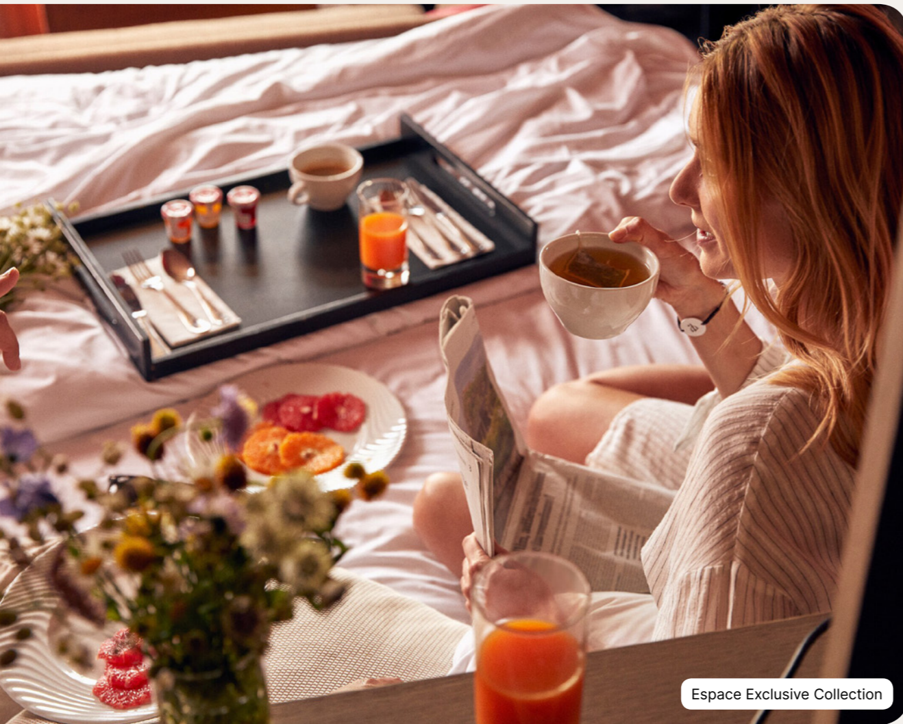
Espace Exclusive Collection