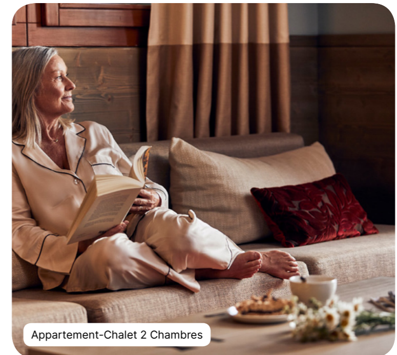
Appartement-Chalet 2 Chambres