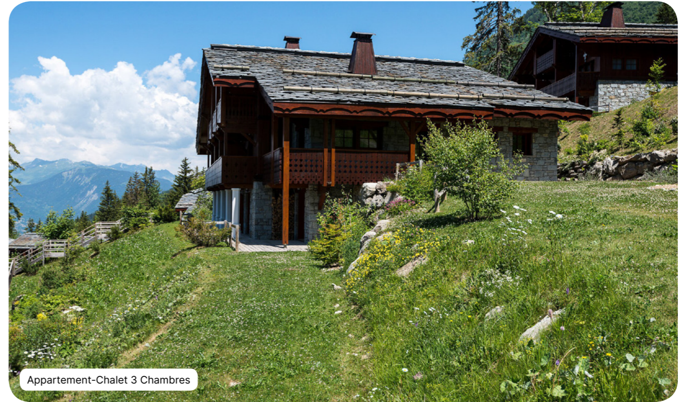
Appartement-Chalet 3 Chambres