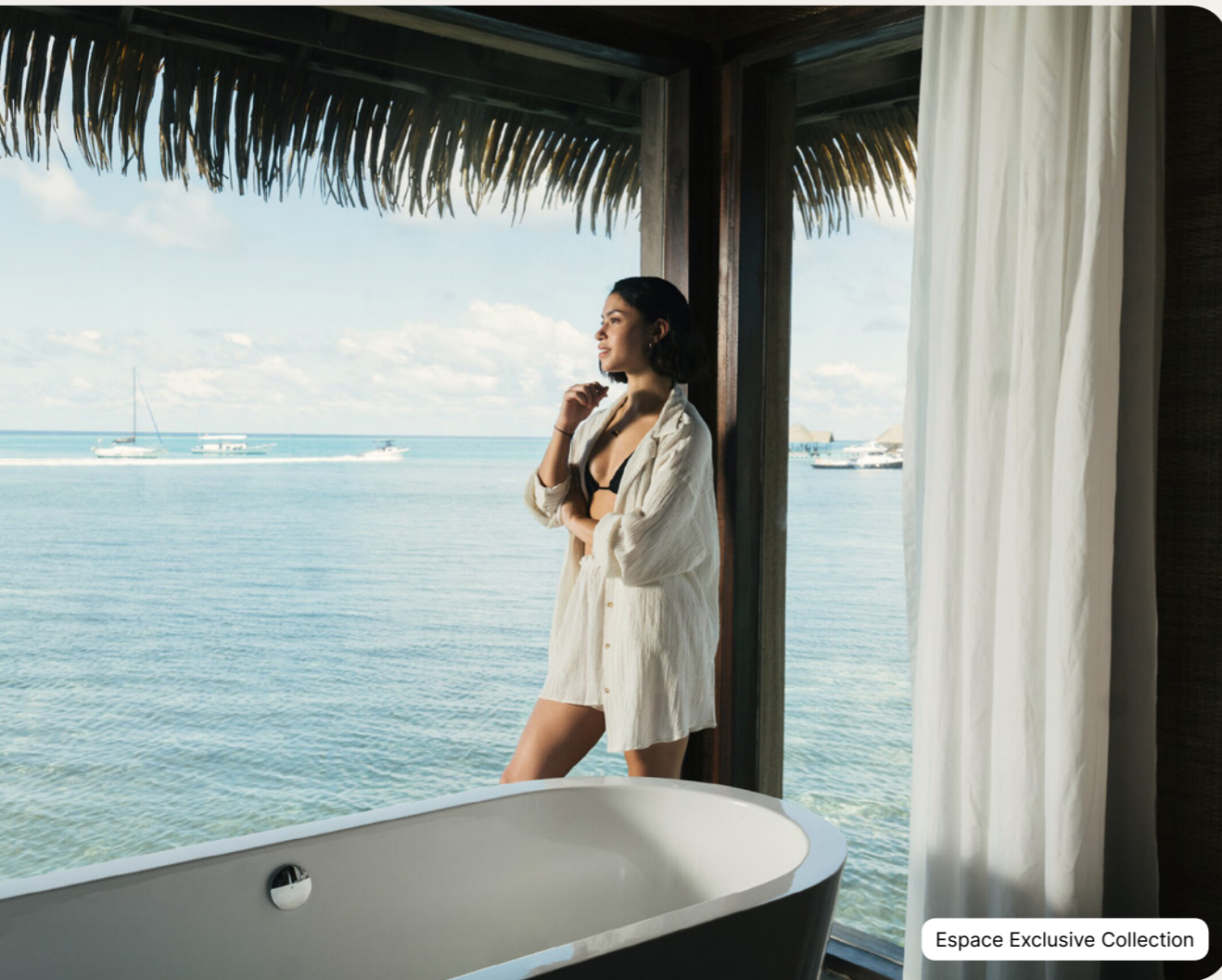
Espace Exclusive Collection