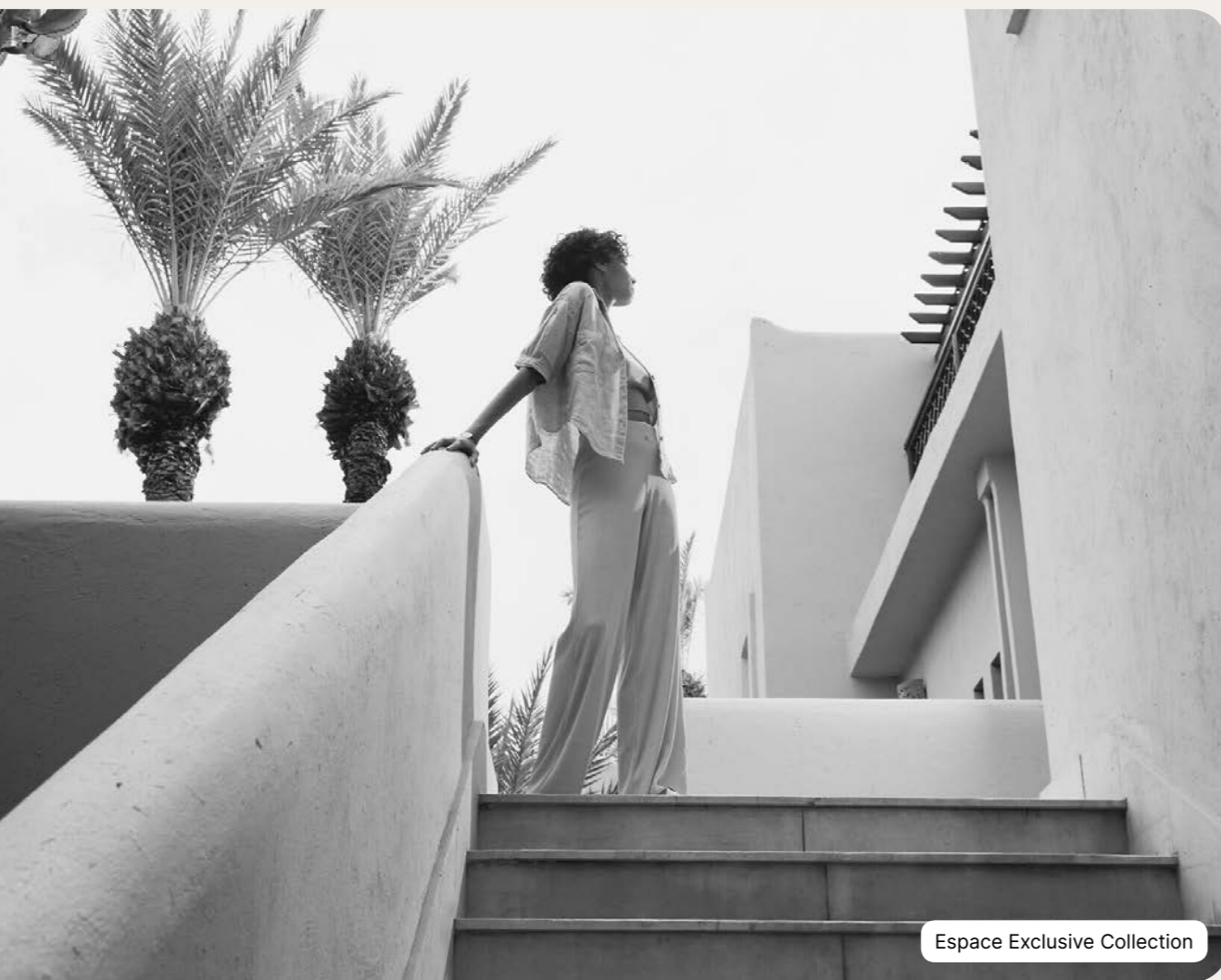
Espace Exclusive Collection