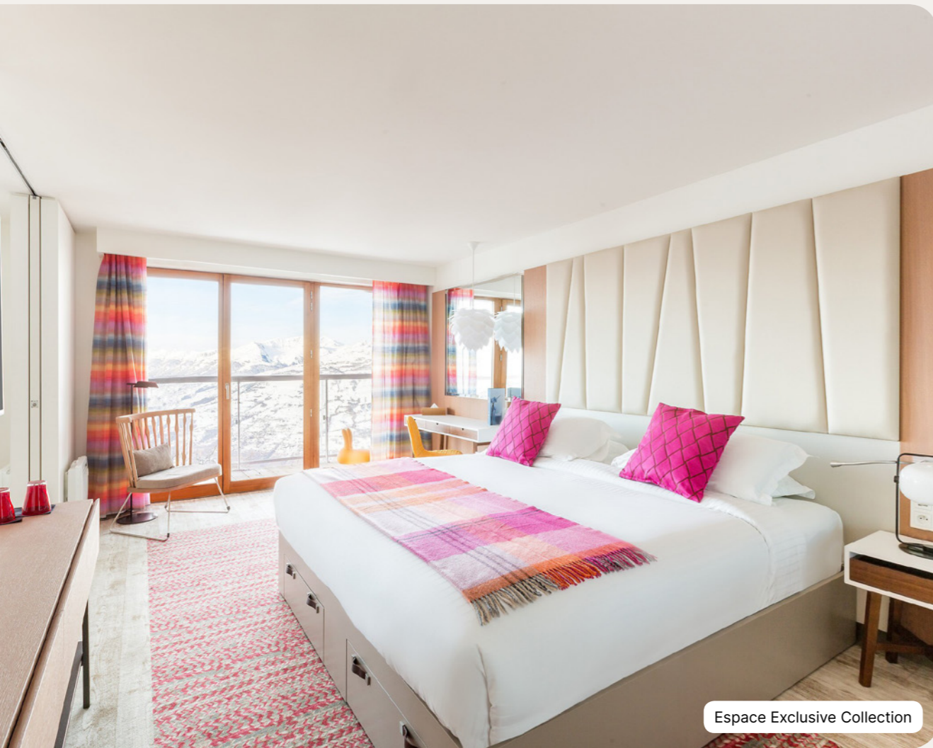
Espace Exclusive Collection