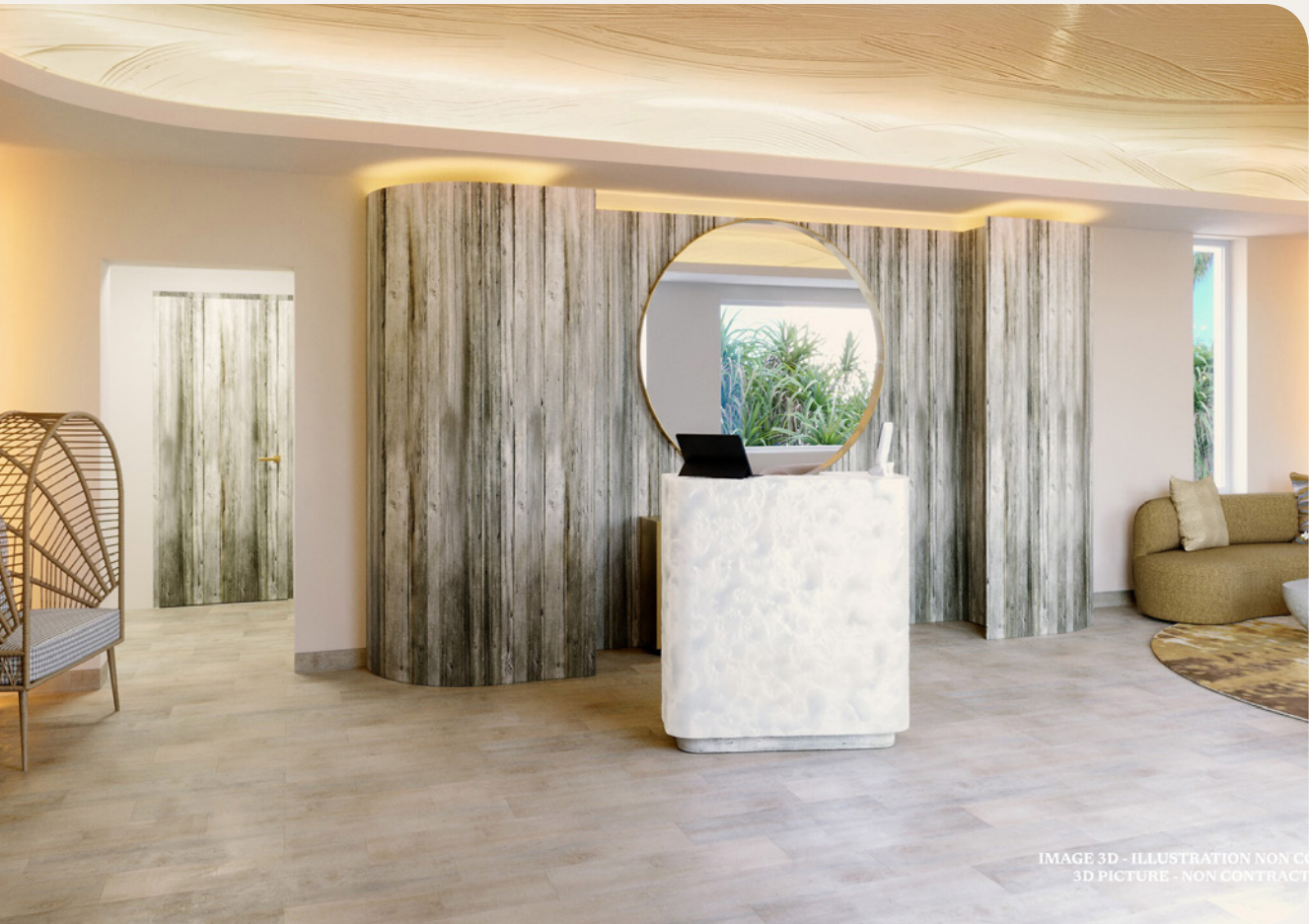
IMAGE 3D - ILLUSTRATION NON CONTRACTUELLE 3D PICTURE - NON CONTRACT

Sothys, maison prestigieuse sublimant l'art du soin professionnel avec technologie, sensorialité et naturalité, incarne l'excellence française depuis 1946. Les rituels Terres d'Afrique mêlent science et traditions. Thérapies éthiques, inspirées de plantes africaines, célébrant santé et planète.