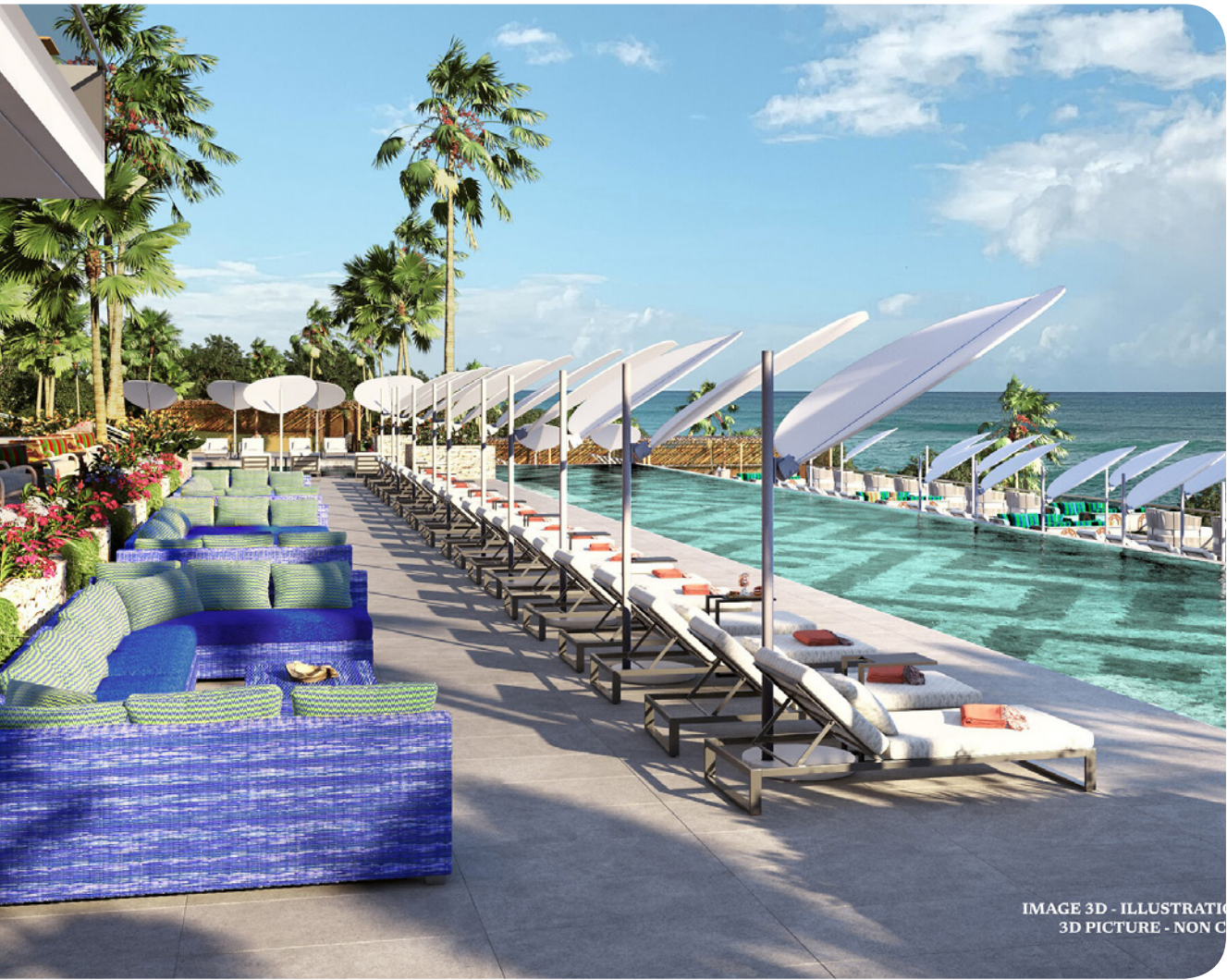
IMAGE 3D - ILLUSTRATION 3D PICTURE - NON CONTRACTUEL