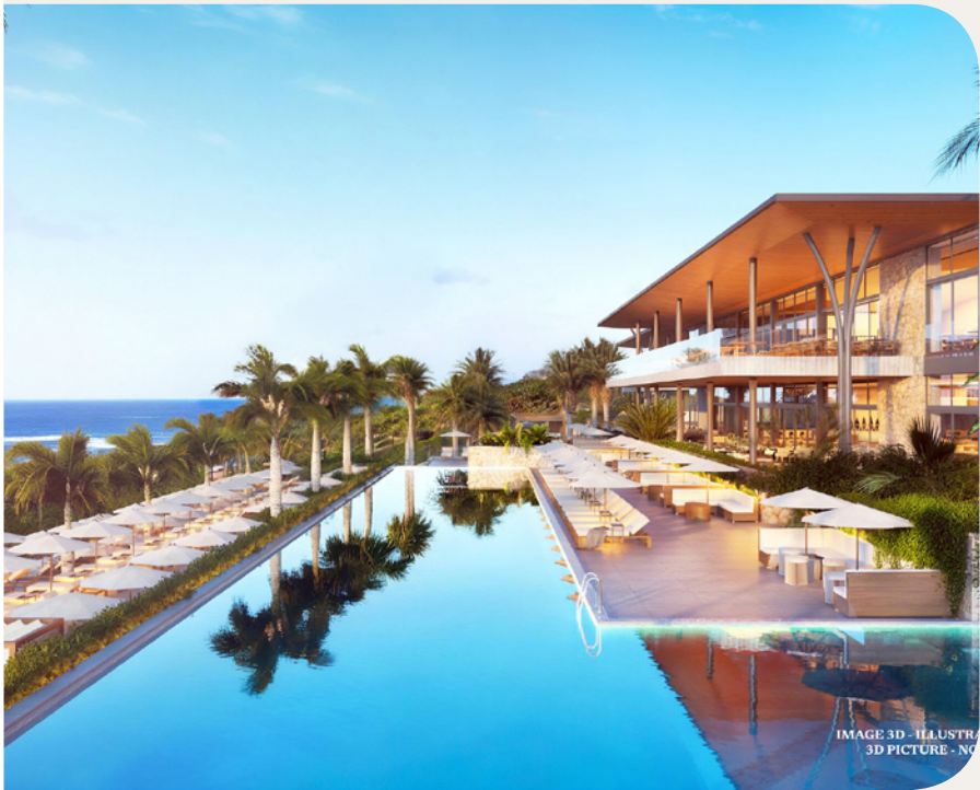
IMAGE 3D - ILLUSTRATION 3D PICTURE - NON CONTRACTUEL

La piscine principale, en forme de L se situe face à l'océan au coeur du Resort. Dotée de profondeurs variées, elle est adaptée à tous les nageurs. Les enfants sont sous la surveillance de leurs parents ou accompagnants.