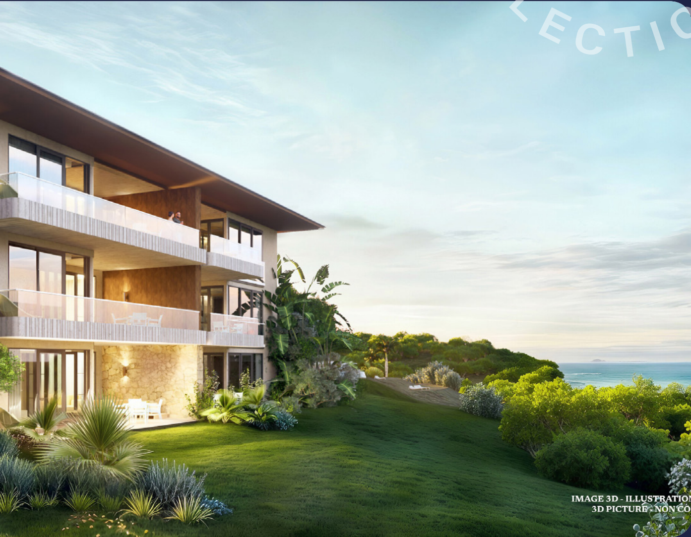
IMAGE 3D - ILLUSTRATION 3D PICTURE - NON CONTRACTUAL

Choisissez de vivre une expérience unique et intime dans l'Espace Exclusive Collection.