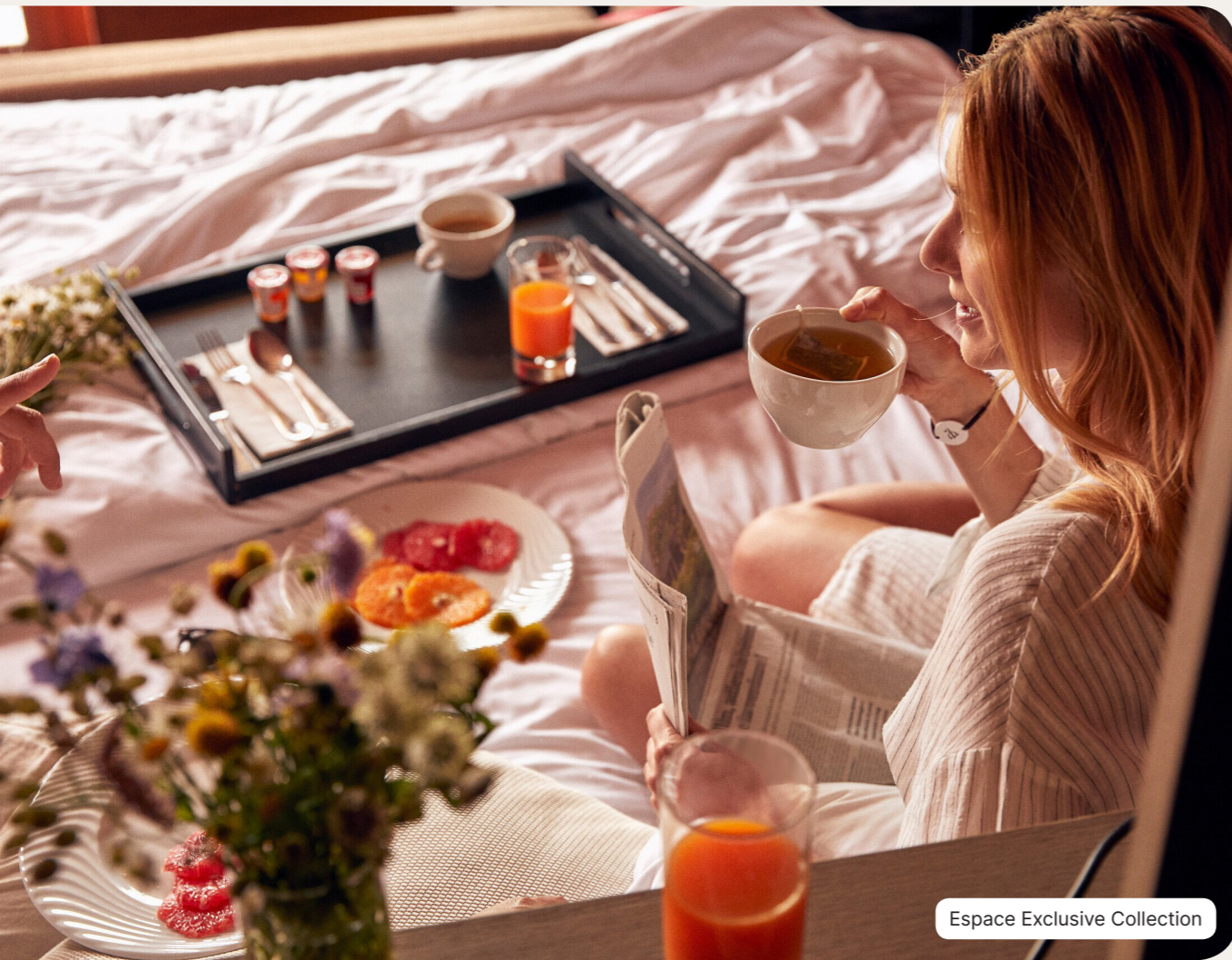
Espace Exclusive Collection