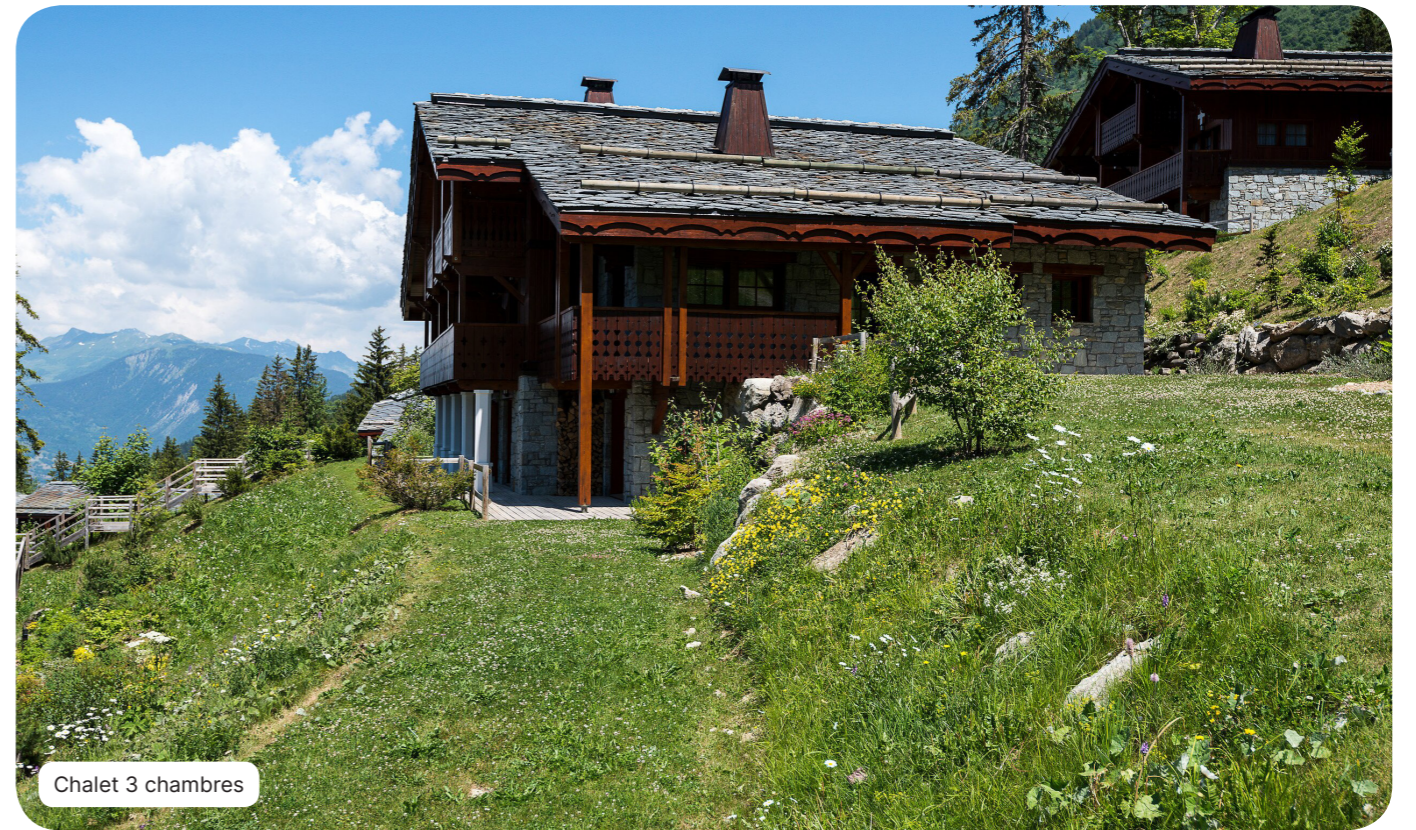
Chalet 3 chambres