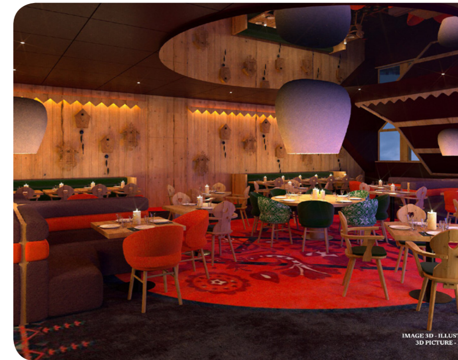
IMAGE 3D - ILLUSTRATION 3D PICTURE

Quest'estate, La Meije si trasforma: aperta come zona tranquilla durante il giorno e la sera per aperitivi al tramonto o serate a base di fonduta.