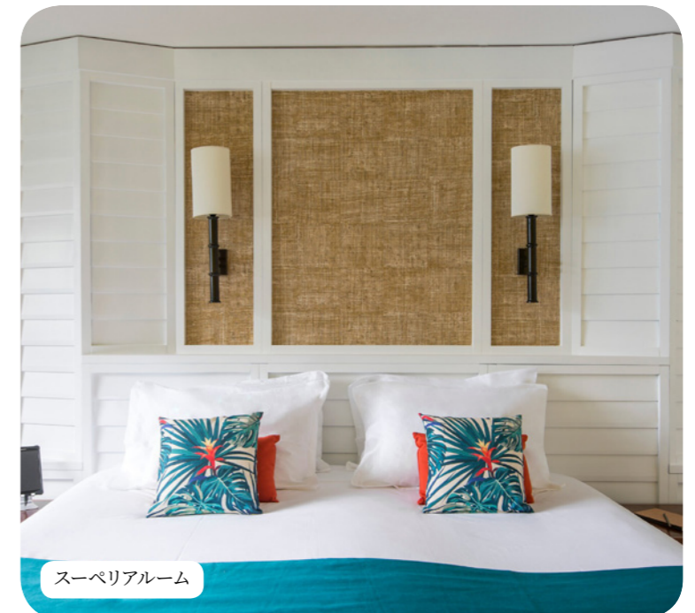
スーペリアルーム