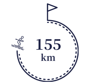
アルペンスキーコース