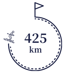
알파인 스키 슬로프