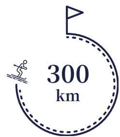
알파인 스키 슬로프