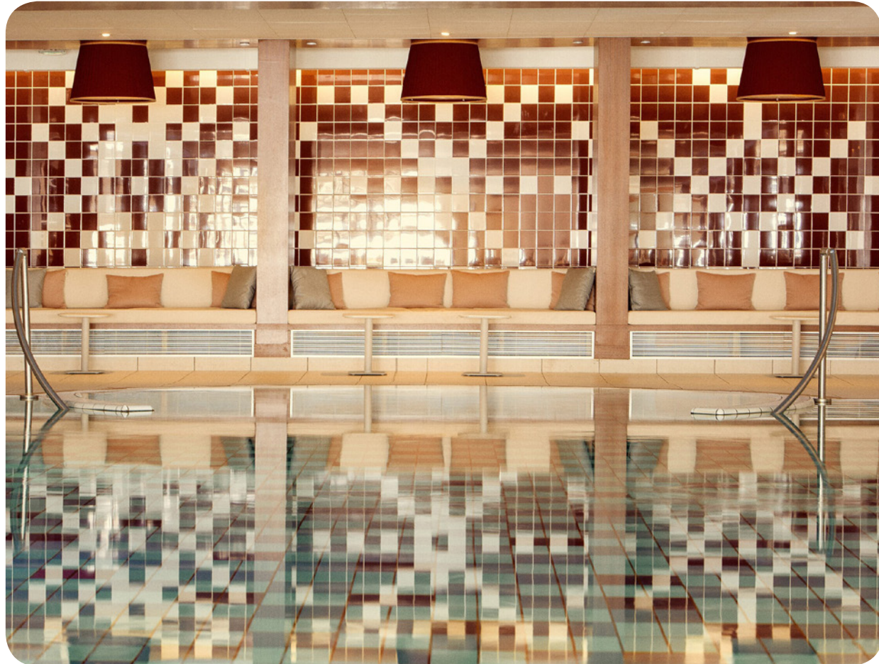
넓은 창문과 휴식 공간이 있습니다. 수심 (최소/최대): 1m / 1.4m 난방