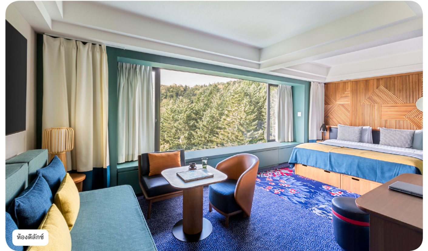
ห้องดีลักซ์