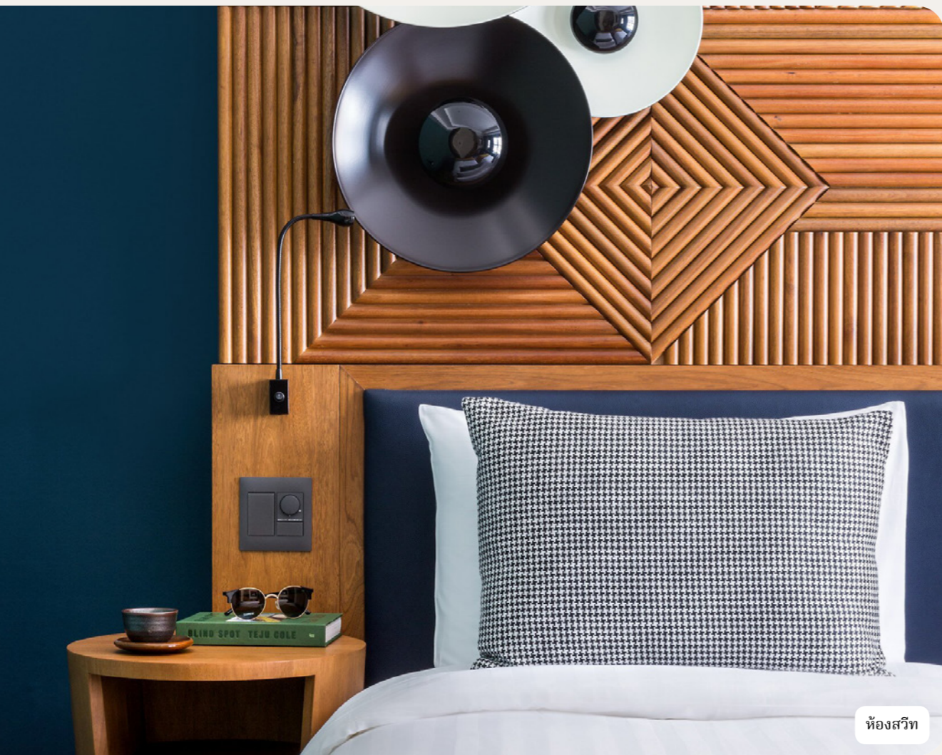
ห้องสวีท