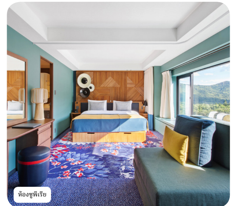
ห้องซูพีเรีย