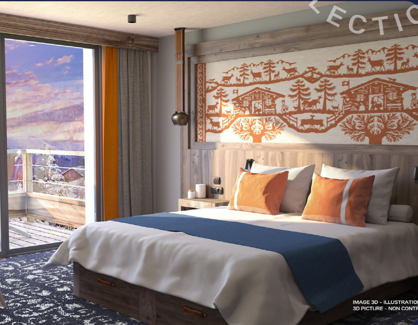
IMAGE 3D - ILLUSTRATION 3D PICTURE - NON CONTR

Enjoy a unique and intimate experience in the Exclusive Collection Space.