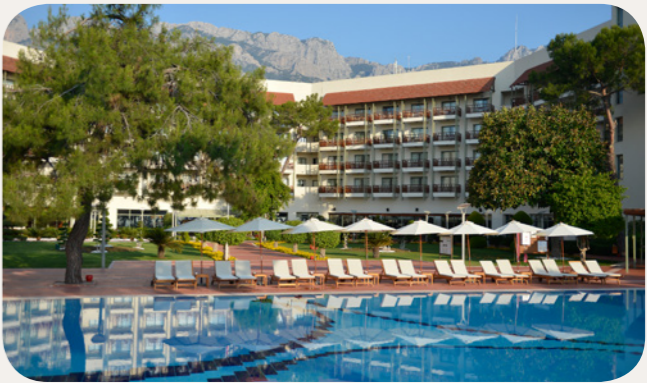
飯店游泳池 戶外游泳池

這個無限的淡水游泳池位於酒店； 為了您的舒適, 它配備了柚木, 遮陽傘和淋浴躺椅。 2018年夏天, 游泳池將無法使用。 加熱的 – At the beginning and end of the season, depending on weather conditions.