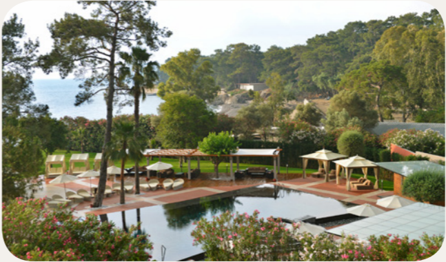
成人靜池 戶外游泳池

這個淡水游泳池歡迎您的一天。成人和16歲以上的成年人陪同入場。為了您的信息:游泳池配有躺椅和遮陽傘, 毛巾可以在泳池入口處借出。 游泳池在2018年夏天不開放。 加熱的 – At the beginning and end of the season, depending on weather conditions.