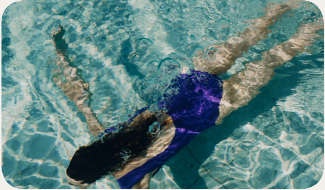
Club Med 水療池 室內游泳池

淡水游泳池, 僅供在 Club Med 水療中心預訂護理的 GM® 使用。 前往水療中心提前預約 深度(最淺/最深): 1.7公尺 / 1.7公尺