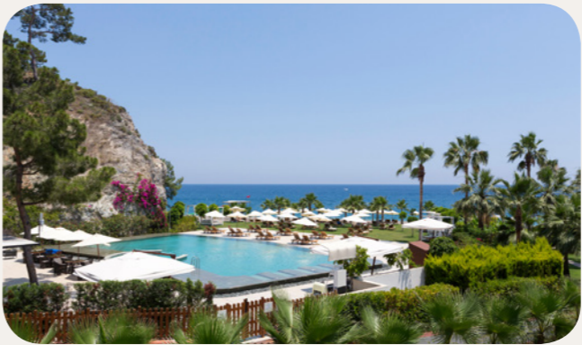
Zen Pool Villagio 戶外游泳池

Located alongside the beach, near the waterskiing area and not far from the children’s club facilities, this pool is reserved for adults over 18. 加熱的 – At the beginning and end of the season, depending on weather conditions.